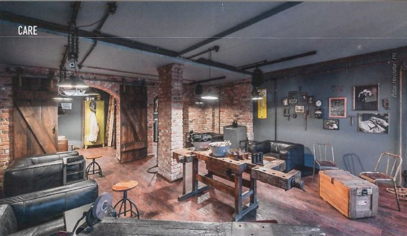
For men only: Der Behandlungsraum von Hammer & Nagel