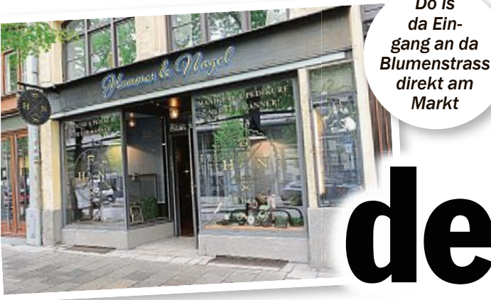
Do is da Eingang an da Blumenstrass direkt am Markt