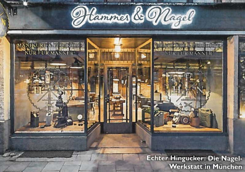
Echter Hingucker: Die Nagel-Werkstatt in München