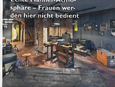
Echte Hammer-Atmosphäre – Frauen werden hier nicht bedient