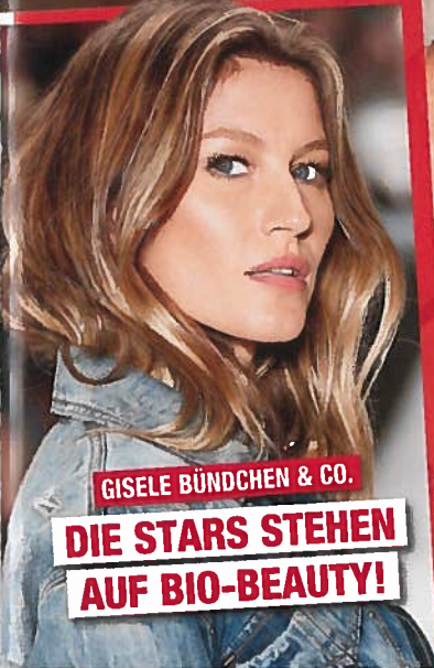
GISELE BÜNDCHEN & CO.

“Call me Caitlyn” BRUCE (CAITLYN) JENNER Endlich darf er Frau sein!