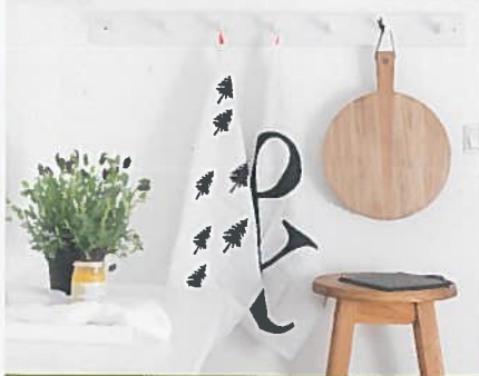
: ON THE LINE Die schönsten Funde aus dem Netz