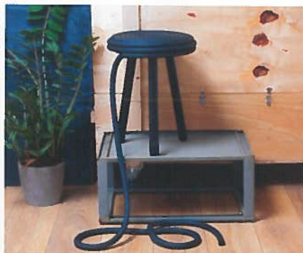
: DESIGN Vom Showstück bis zur Zuckerperle