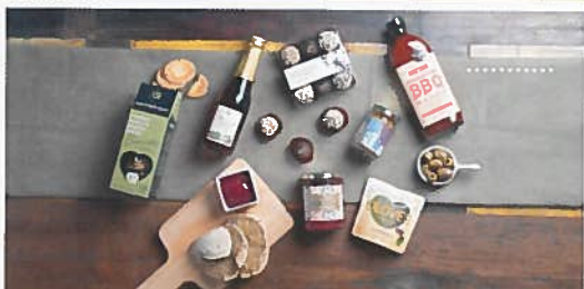
: GENUSS Macht jetzt warm ums Herz