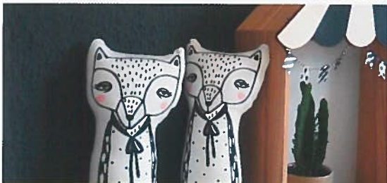
: EINGETÜTET Das kommt in die Shoppingbag